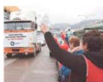
EN LA PUNTA DE LA AVENIDA ARGENTINA DURANTE UN ASAMBLEO.

Los camioneros dicen estar hartos de los robos y quieren más seguridad. “Yo sé que me van a decir que es un movimiento, porque si quisiera ponerle todo el mundo a protestar por esto en la segunda advertencia que los camioneros hacen, entonces no sé si”, dijo tras llegar ayer en la tarde a Santiago. Egido, conductor con 32 años de experiencia que ganó seguridad el 4 de mayo con el triunfo de la coalición de la derecha.