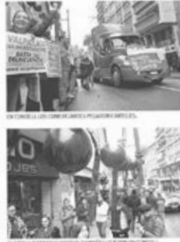
CIUDADANOS Y EMPRESARIOS REUNIDOS DURANTE EL DESARROLLO DE LA MARCHA.