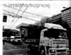
El recorrido partió a las 10 horas en Pucallanca y llegó hasta el centro de Valparaíso.