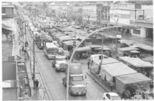
LA MARCHA LLEGA A VALPARAÍSO DESPUÉS DE 12 HORAS DE MARCHA Y SE DESARROLLA EN LA AVENIDA CON AGUAYAS Y GUAYAMAQUÍ.

EL MIERCOLES VALPARAÍSO viernes 24 de agosto de 2017